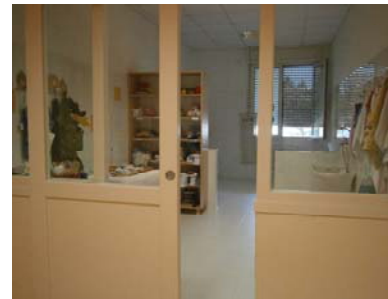
bagno interno alla sezione