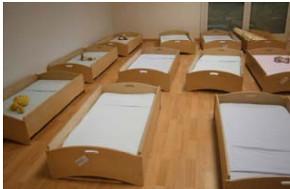
la camera da letto dei grandi