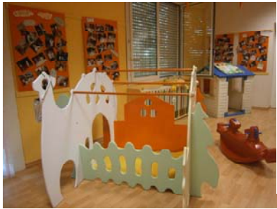
tana, la sezione gialla

Inoltre è presente un locale adibito ad “atelier” in cui gli arredi e i materiali presenti rendono agevoli tra l’altro le attività di pittura con le tempere, collages, travasi, costruzioni e i giochi con la sabbia, oltre a tutte le esperienze proposte al piccolo gruppo composto da bambini di differenti sezioni. Questo spazio consente al bambino di sperimentare diverse possibilità: travasare, incastrare, infilare, aprire e chiudere, offrendo la possibilità di sperimentare percezioni sensoriali, tattili, olfattive, visive e sonore. Nella bella stagione i bambini possono mangiare e giocare all’aperto, lo spazio è attrezzato con scivoli, tricicli e macchinine.