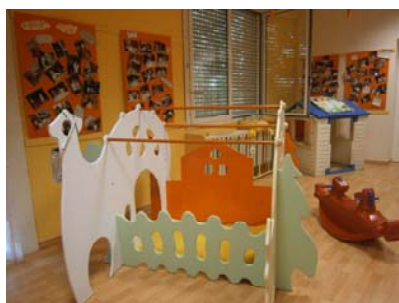
tana, la sezione gialla

Inoltre è presente un locale adibito ad “atelier” in cui gli arredi e i materiali presenti rendono agevoli tra l’altro le attività di pittura con le tempere, collages, travasi, costruzioni e i giochi con la sabbia, oltre a tutte le esperienze proposte al piccolo gruppo composto da bambini di differenti sezioni. Questo spazio consente al bambino di sperimentare diverse possibilità: travasare, incastrare, infilare, aprire e chiudere, offrendo la possibilità di sperimentare percezioni sensoriali, tattili, olfattive, visive e sonore. Nella bella stagione i bambini possono mangiare e giocare all’aperto, lo spazio è attrezzato con scivoli, tricicli e macchinine.