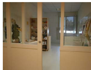
bagno interno alla sezione