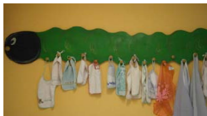
il bruco "porta-tovaglioli" dei grandi