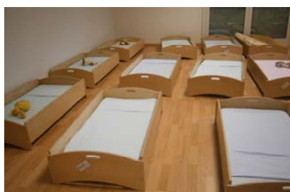
la camera da letto dei grandi