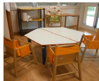
refettorio sezione arancione