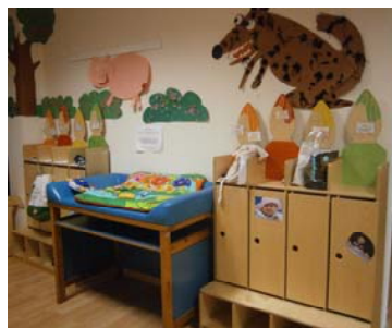
ingresso con armadietti